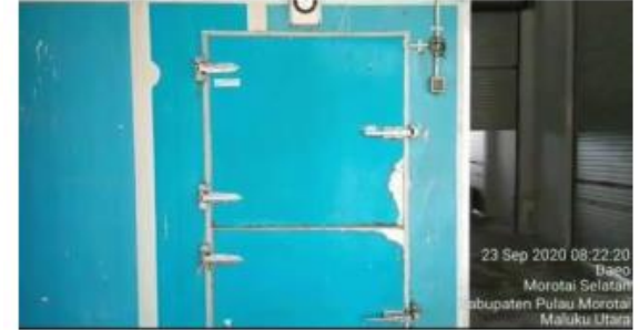
Ice Flake Machine capacity 5 ton ice /day