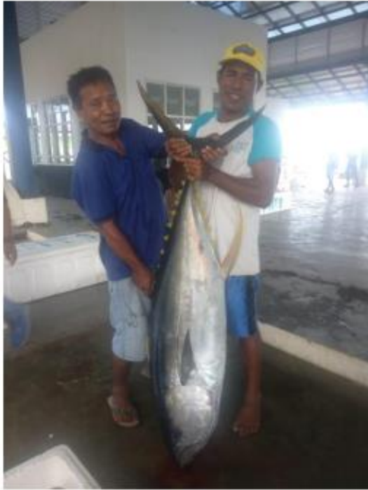
Fetch big yellowfin tuna sashimi grade