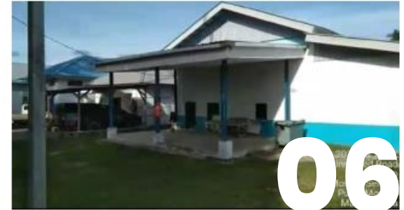
Cold storage capacity 50 ton -35° C ABF