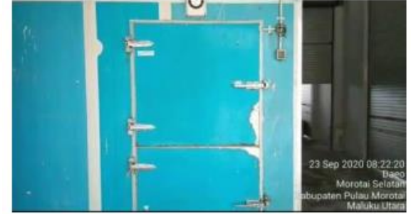
Ice Flake Machine capacity 5 ton ice /day