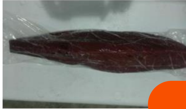
Tuna Loin Products