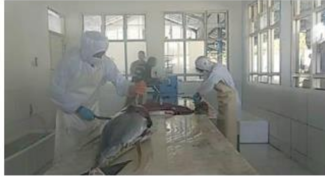
Tuna Loin Processing